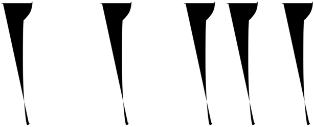
A E d c a d a b b c d